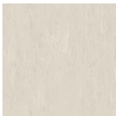
Nimbus Grey 2710 w/r 0630 NCS S 1505-Y60R LRV 70