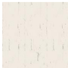
Dove White 2700 w/r 2700 NCS S 0603-Y40R LRV 72

w/r - Varilla de soldadura LRV - Valor de reflectancia de la luz NCS - Sistema de color natural