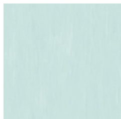
Summer Sky 2830 w/r 4430 NCS S 1510-B80G LRV 61